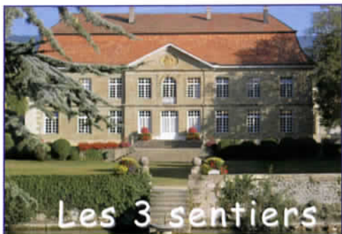
Les 3 sentiers du 300e