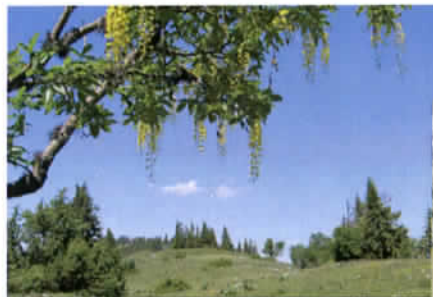
Les 7 villages